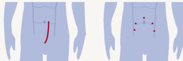
Incisión de prostatectomía abierta

Uno de los tratamientos más comunes para el cáncer de próstata, conocido como prostatectomía radical, implica la extirpación quirúrgica de la glándula prostática. La prostatectomía radical tradicional requiere una incisión de 8 a 10 pulgadas. Esta cirugía abierta normalmente trae como consecuencia una pérdida importante de sangre, una recuperación prolongada e incómoda y el riesgo de sufrir impotencia e incontinencia.